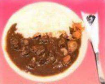
焼肉屋さんのカレー 倉石牛ごろごろカレーライス