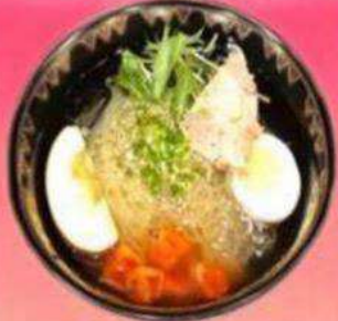
焼肉屋さんの冷麺